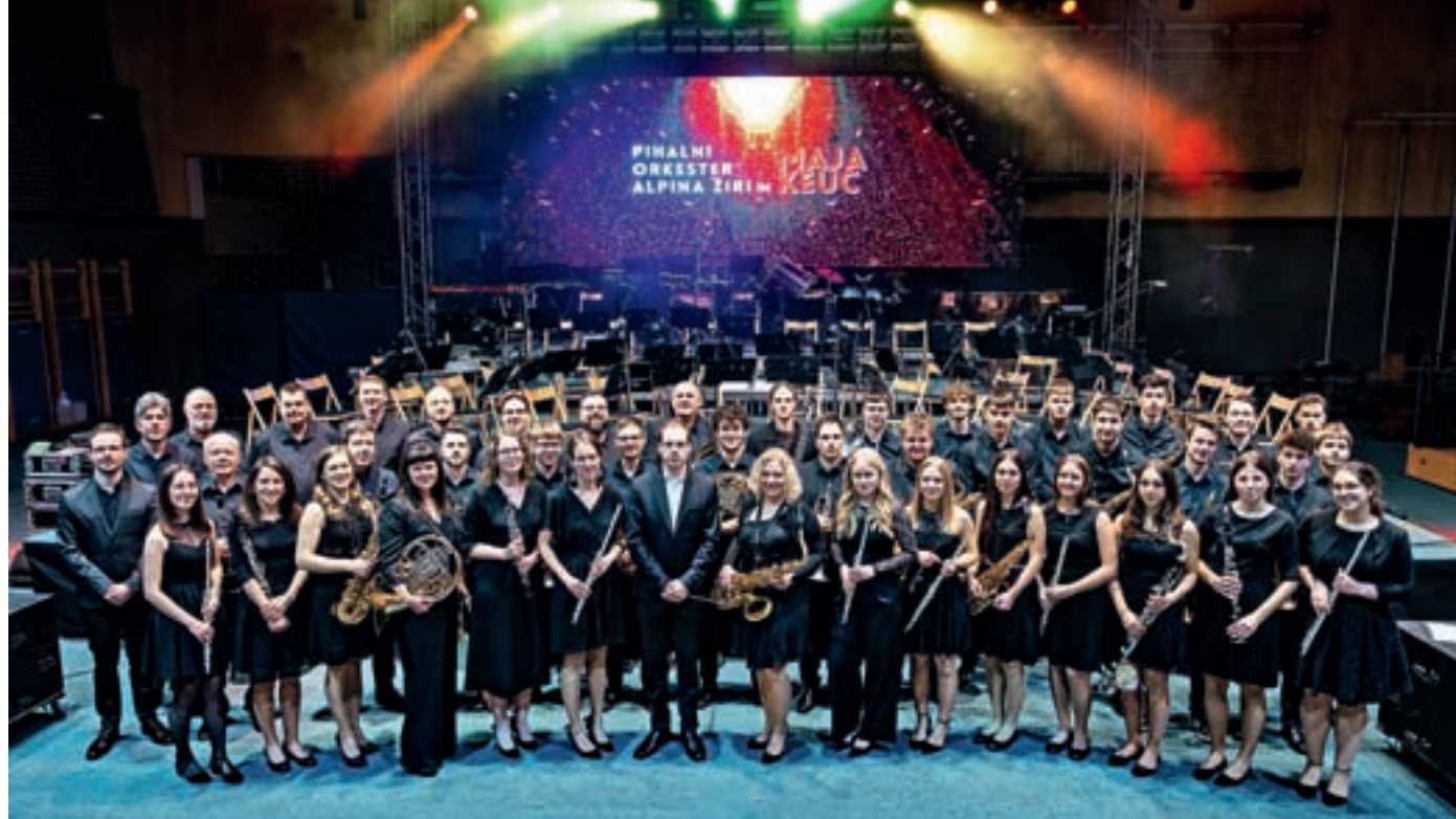
Pihalni orkester Alpina Žiri