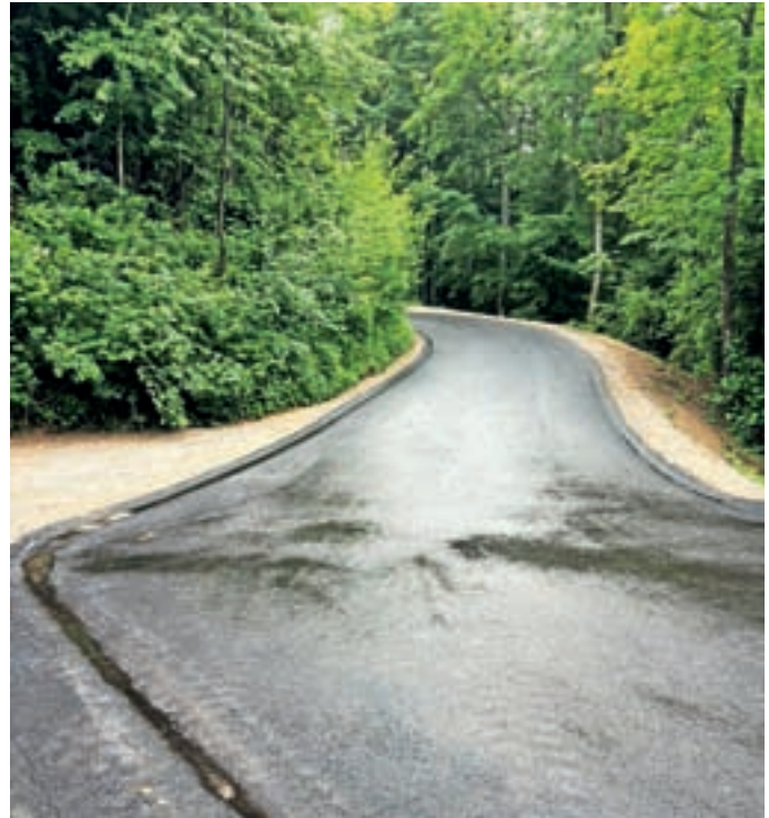
Obnovljeni odsek na cesti Breznica–Korita

Že konec maja pa se je zaključila rekonstrukcija 250 metrov dolgega odseka na lokalni cesti Breznica–Korita. Projekt je obsegal celovito prenovo cestišča. Izvedli so zamenjavo ustroja vozišča, poskrbeli za odvajanje meteorne vode in drenažo ter cesto ponovno asfaltirali, je razložil Kavčič. »Prav tako se je uredilo tudi križišče v kraju Breznica z vsemi pripadajočimi odcepi oziroma uvozi. Naložba je bila vredna 80 tisoč evrov. V teh dneh pa se zaključuje še obnova dvesto metrov dolgega odseka na cesti Pot na Koče. Po novem bo cesta tudi širša, saj bo vozišče razširjeno na štiri metre, kar bo bistveno izboljšalo prometne razmere in varnost,« je razložil Kavčič. V okviru del so izvedli zamenjavo ustroja vozišča in zgradili nov meteorni kanal za učinkovito odvajanje padavinskih voda. Poleg tega so obnovili javno razsvetljava in postavili dodatne svetilke. Vrednost del je znašala 90 tisoč evrov, je še dejal Kavčič.