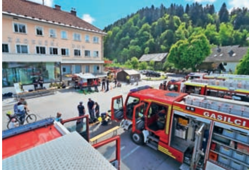
Civilna zaščita Občine Žiri in žirovska gasilska društva so predstavili svoje delo občanom.

Predstavila so se vsa štiri žirovska prostovoljna gasilska društva – PGD Brekovice, PGD Dobračeva, PGD Račeva in PGD Žiri. Obiskovalci so si lahko ogledali gasilska vozila, zaščitno opremo ter različne pripomočke, ki jih gasilci uporabljajo pri gašenju požarov, reševanju ob prometnih nesrečah, reševanju iz zadimljenih prostorov, reševanju iz višin in drugih intervencijah. Predstavitvi se je z opremo za vodenje intervencij pridružila tudi Civilna zaščita Občine Žiri, ki je predstavila svojo vlogo pri zaščiti in reševanju ob naravnih nesrečah ter drugih izrednih dogodkih. Obiskovalci so lahko izvedeli več o organizaciji sistema zaščite in reševanja ter pomenu sodelovanja med različnimi službami, ki skrbijo za