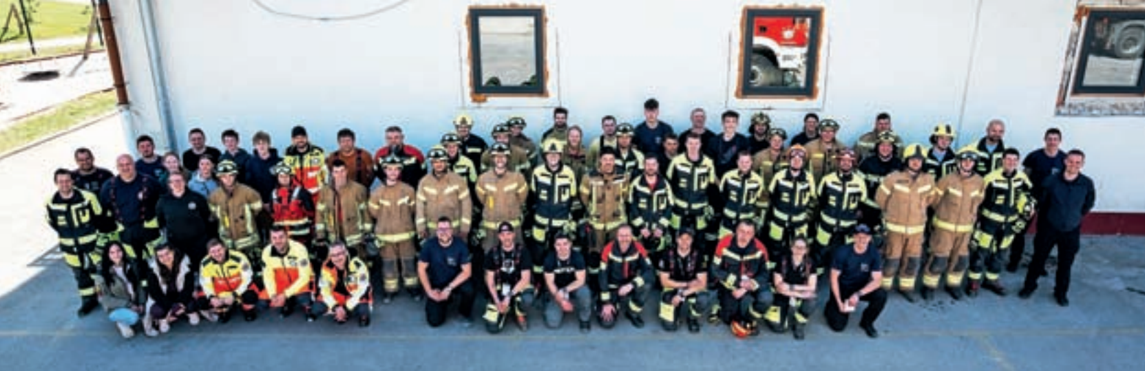
Skupinska fotografija vseh sodelujočih