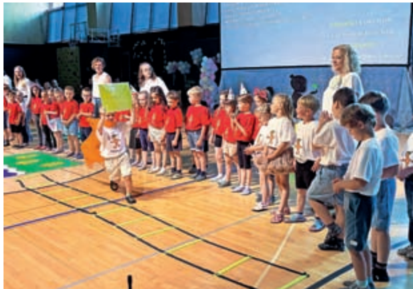
S prireditvijo v športni dvorani je Vrtec pri Osnovni šoli Žiri konec maja zaznamoval petdesetletnico delovanja.