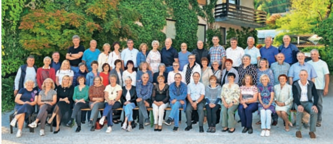
Petdeseta obletnica valet