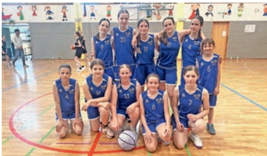
Mlajše košarkarice

Poslovia se je letošnja generacija žirovskih devetošolcev. Z zaključkom osnovne šole zapirajo pomembno poglavje in stopajo novim dogodivščinam naproti. Prihaja čas, ko bo življenje prednje postavljalo številne preizkušnje, ko bodo sprejemali odločitve, težke in hitre, delali napake in se na njih učili, zato je pomembno, da ostajajo trdni, vztrajni in uspešni tudi v srednjih šolah.