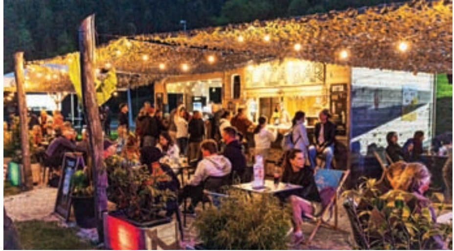
Od roka do žlikrofov – poletje na Pustotniku po žirovsko

Glasbeno društvo Frekvenca letos že drugo sezono zapored skrbi za pestro poletno dogajanje v Žireh.