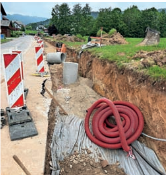
Na cesti Pod griči bodo dogradili pločnike v dolžini 450 metrov.