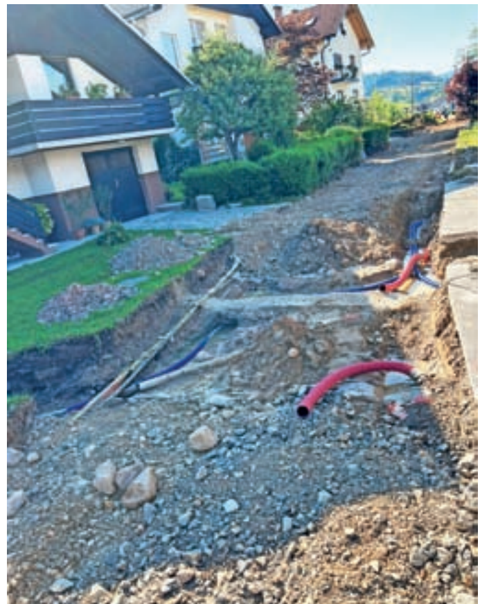
V teh dneh so končali tudi obnovo ceste Pot na Koče.