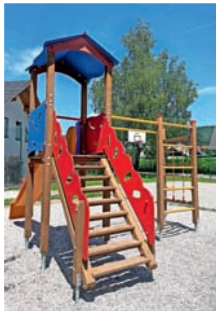
Nova igrala najmlajšim nudijo še več možnosti za igro, gibanje in druženje na prostem.

Ob tem so na občini še dodali, da nova pridobitev predstavlja pomemben korak k ustvarjanju prijetnega in varnega okolja za družine z otroki. Jeseni bodo okoli igrišča zasadili tudi dodatna drevesa in tako poskrbeli še za prijetno senco. Na občini so ob tem uporabnike novih pridobitev na igrišču pozvali, naj z javno opremo ravnajo skrbno in spoštljivo, da bo čim dlje služila namenu.