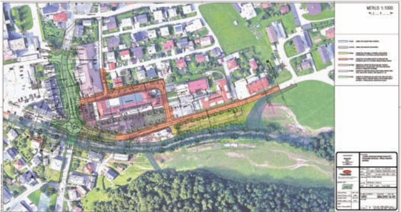
Prikaz obsega ureditve središča Žirov in faznosti gradnje

Na javnem razpisu izbran izvajalec del za prvi sklop ureditev središča Žirov, VGP iz Kranja, v tem mesecu začenja gradbena dela na terenu.