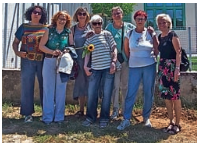
Članice bralnega kluba Zakaj berem? pred Kosovelovo domačijo

Iz Sežane so se zapeljale do Kosovelovega doma v Tomaju, kjer je živel kot otrok, kamor se je po letih šolanja vrnil bolan in sklenil svoje mlado življenje 27. maja 1926. Ogledale so si zunanost prenovljene podeželske vile in vrt. Le streljaj od Kosovelovega nekdanjega doma leži tomajsko pokopališče, kjer so se na grobu poklonile pesniku, mu k vnožju položile sončnico in brale njegove pesmi. Pretresle so jih preroške besede na grobu: Ognja prepoln, poln sil, / neizrabljen k pokoju bom legel. S Kosovelovo interpretacijo sveta in človeka so bralke zaokrožile prvo leto delovanja bralnega kluba.