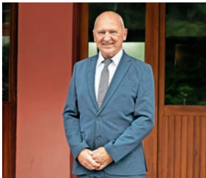
Franci Kranjc

Svetniki so na zadnji seji znova potrdili zvišanje ekonomskih cen programov predšolske vzgoje. Kaj je tokrat botrovalo dvigu cen?